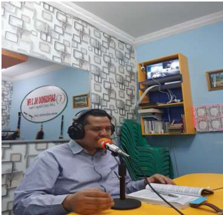
Memperagakan teknik menyampaikan materi

Penentuan keterampilan prioritas dimaksudkan untuk menetapkan pemilihan keterampilan berbahasa Inggris yang sangat layak diajarkan melalui media radio.