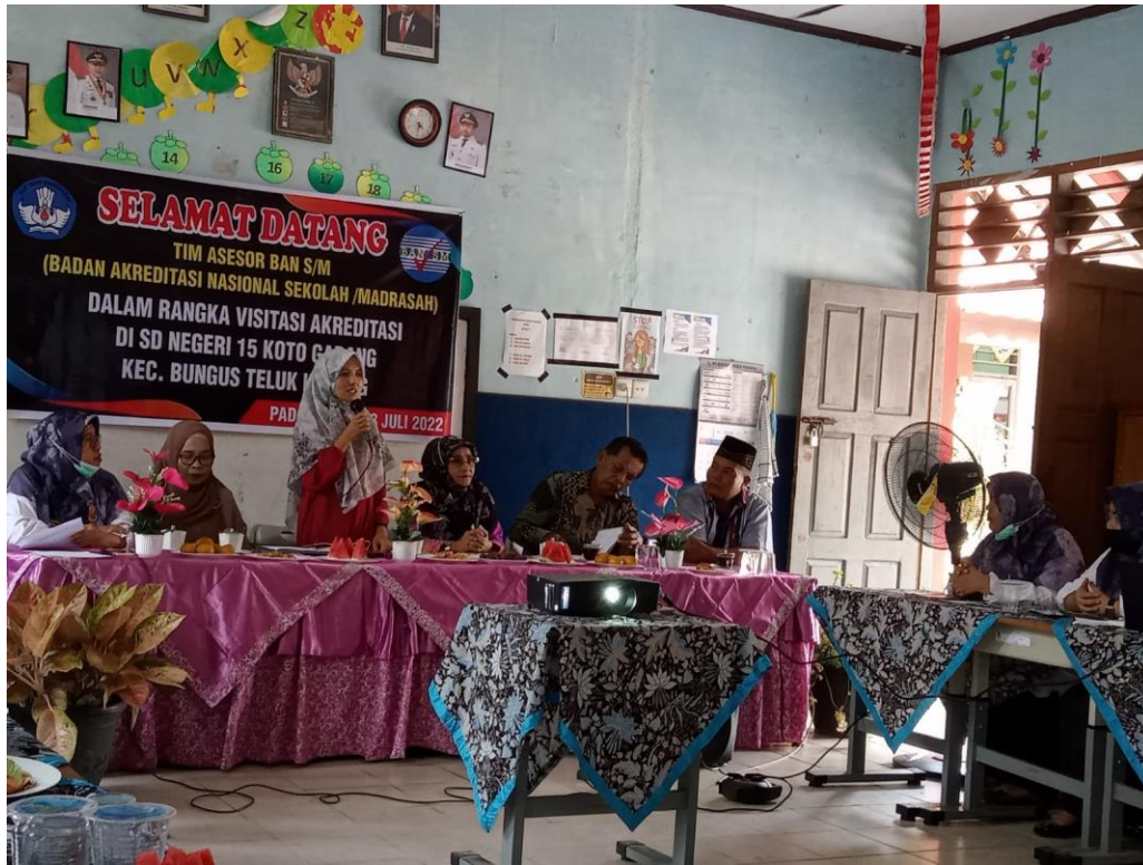
Visitasi hari 4 di SDN 15 koto gadang kota padang, 23 juli 2022