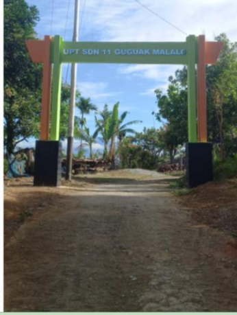
FOTO KEGIATAN PkM DI SDN 11 GUGUAK MALALO BATIPUH SELATAN