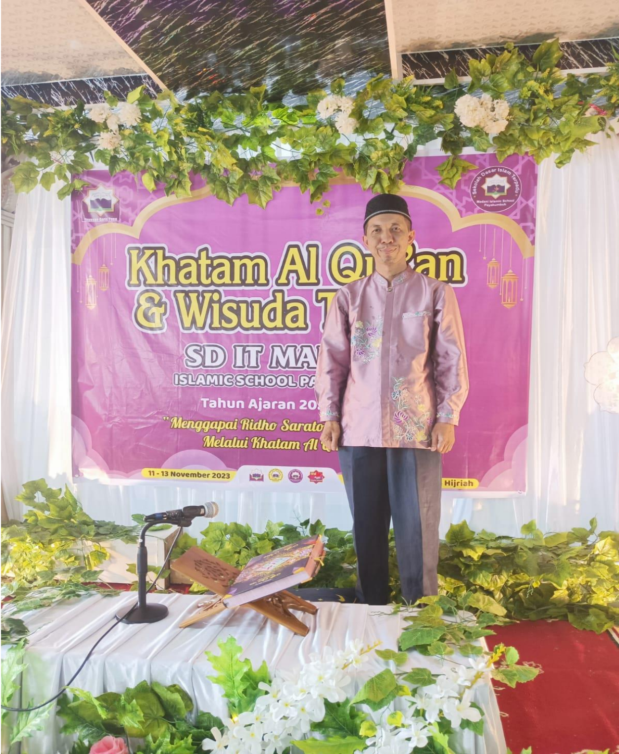
Dokumen kegiatan Juri MDTA madani Islamic school payakumbuh