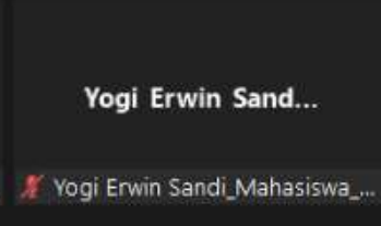
Yogi Erwin Sand...