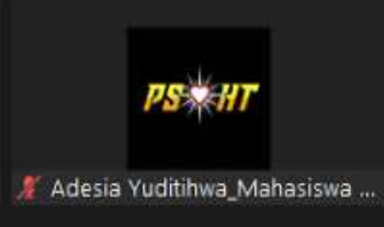
Adesia Yudithwa_Mahasiswa ...