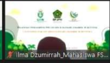
Ilma Dzumirrah_Mahasiswa FS...