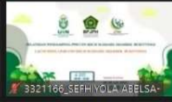
3321166_SEFH YOLA ABELSA-